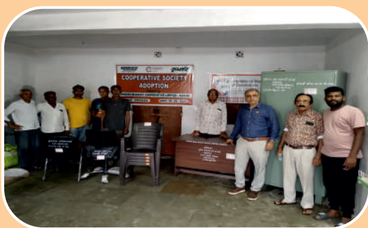
Cooperative Society Adoption Program