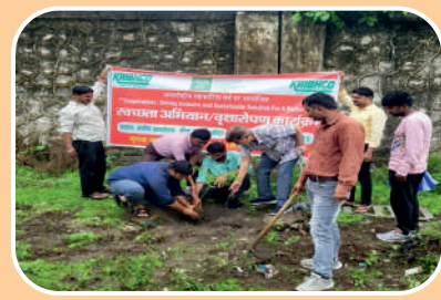
Cleanliness Campaign and Tree Plantation Program