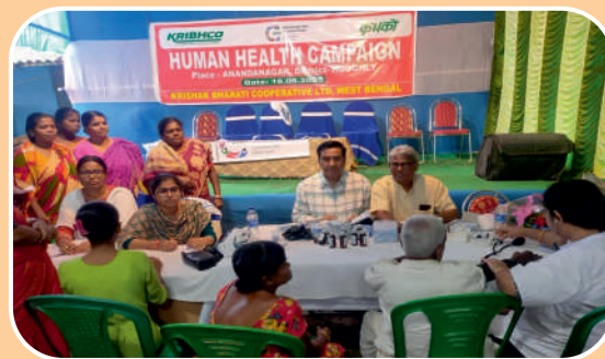
Human Health Campaign