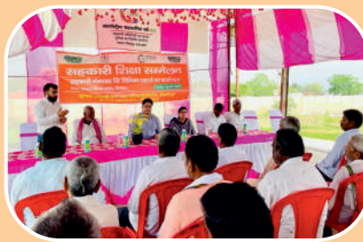
Cooperative Education Conference