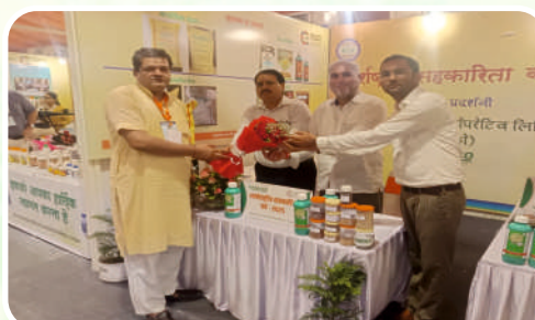
Key Dignitaries Visited the KRIBHCO stall at the Sahkar and Rojgar Utsav