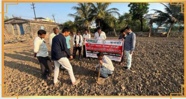
જમીન ચકાસણી અભિયાન: કેસરિયા, તાલુકો: ઉના, જિલ્લો: ગીર સોમનાથ, ગુજરાત