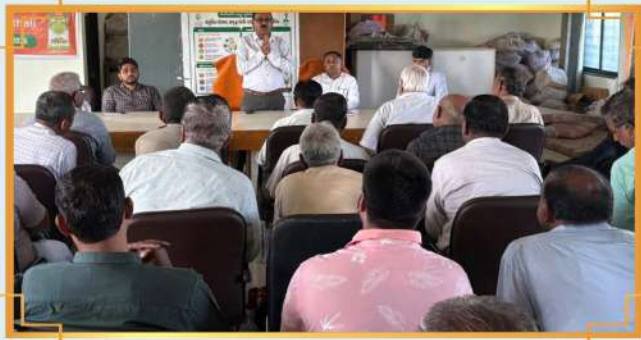
ડીલર્સ કોન્ફરન્સ: વંથલી, તાલુકો: વંથલી, જિલ્લો: જૂનાગઢ, ગુજરાત