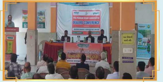
ડીલર્સ કોન્ફરન્સ: લુથાવાડા, જિલ્લો: મહેસાગર, ગુજરાત