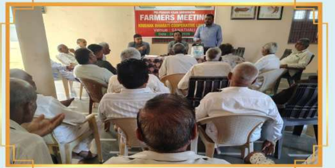
ખેડૂત સભા: સહાયલી, તાલુકો: જસદણ, જિલ્લો: રાજકોટ, ગુજરાત