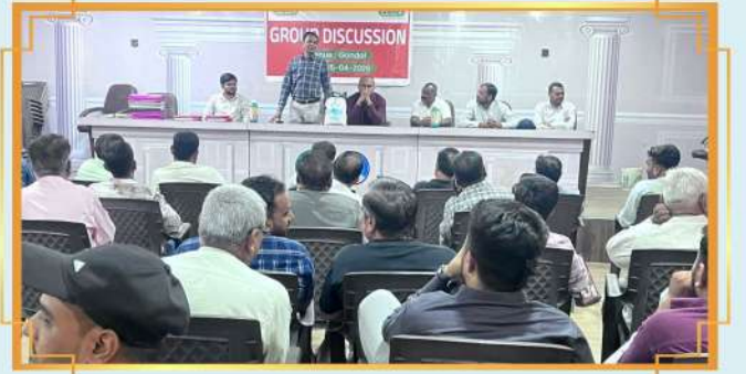
જૂથ ચર્ચા: ગાંધીનગર, જિલ્લો: રાજકોટ, ગુજરાત