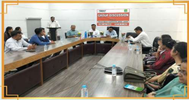
જૂથ ચર્ચા: આણંદ, જિલ્લો: આણંદ, ગુજરાત