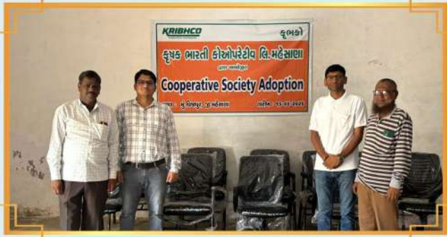
સહકારી મંડળી દત્તક કાર્યક્રમ: વિજાપુર, જિલ્લો: મહેસાણા, ગુજરાત