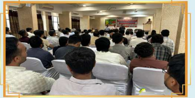
ડીલર્સ કોન્ફરન્સ: ડીસા, જિલ્લો: બનાસકાંઠા, ગુજરાત