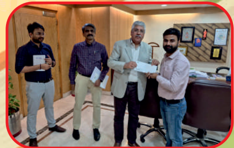
3వ బహుమతి: శుభం, జూనియర్ ఫీల్డ్ ప్రతినిధి